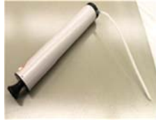
Attrezzo di soffiatura