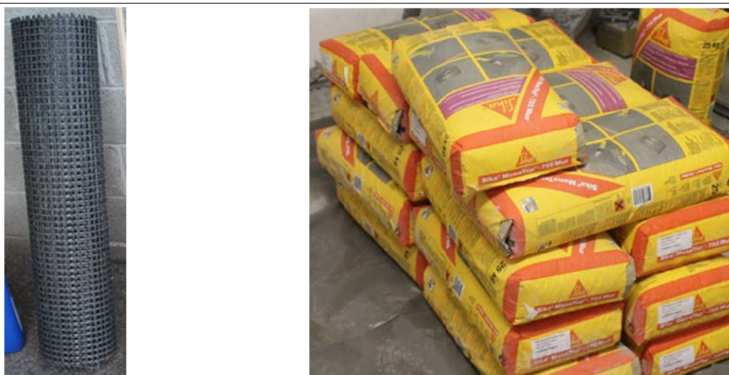
Figura 1: componenti del sistema Sika® TRM SikaWrap®-350 G Grid (a sinistra, rotolo intero) e alcuni sacchi della malta Sika MonoTop®-722 Mur (a destra)

Il sistema Sika® TRM è un sistema per il rinforzo di murature comprendente, come visibile nella figura 1, i prodotti SikaWrap®-350 G Grid e la malta Sika MonoTop®-722 Mur. Questi materiali messi in opera in cantiere creano un sistema di rinforzo composito.