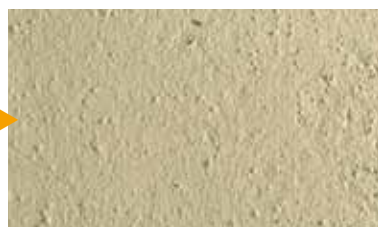
Prima o seconda mano con KEIM Granital