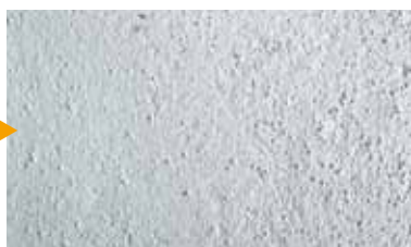
mano di fondo/saturazione delle cavillature con KEIM Contact-Plus Grob