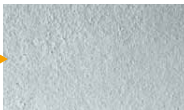
mano di fondo/ponte tra il vecchio e il nuovo supporto con KEIM Contact-Plus