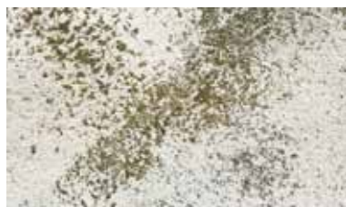
Pittura segnata dalle intemperie